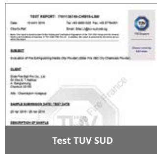
Test TUV SUD