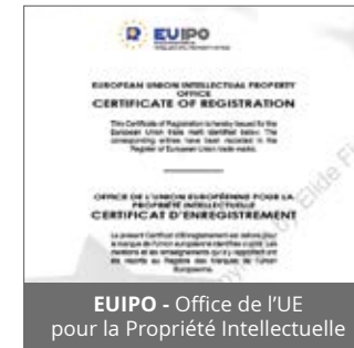
EU IPO - Office de l'UE pour la Propriété Intellectuelle