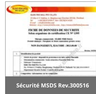
Sécurité MSDS Rev.300516