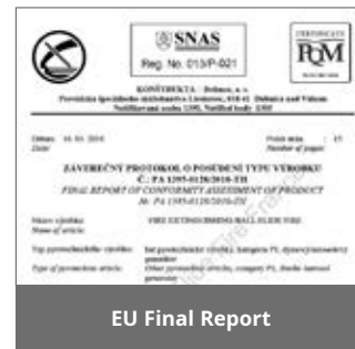
EU Final Report